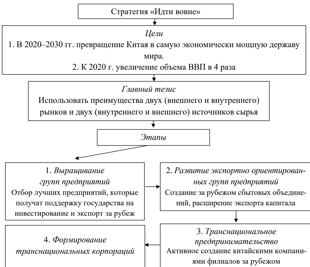
Рис. 4.1. Реализация стратегии КНР «Идти вовне»

проектов в сфере инфраструктуры, добычи и переработки природных ресурсов и др. Основным направлением китайских инвестиций стали страны Азии, а также Африки и Западной Европы. Создание зарубежных представительств китайских компаний сопровождалось выездом из Китая не только предпринимателей, но и наемных работников. С расширением китайских землячеств за рубежом с 2000 г. активизировалась работа Управления по делам хуацяо Госсовета Китая, проводимая в рамках реализации «трудового» направления стратегии «Идти вовне», так как землячества должны способствовать созданию в стране проживания благоприятных условий для выхода китайских предприятий на внешние рынки, а также оказывать содействие в реализации внешнеэкономической стратегии Китая за рубежом.