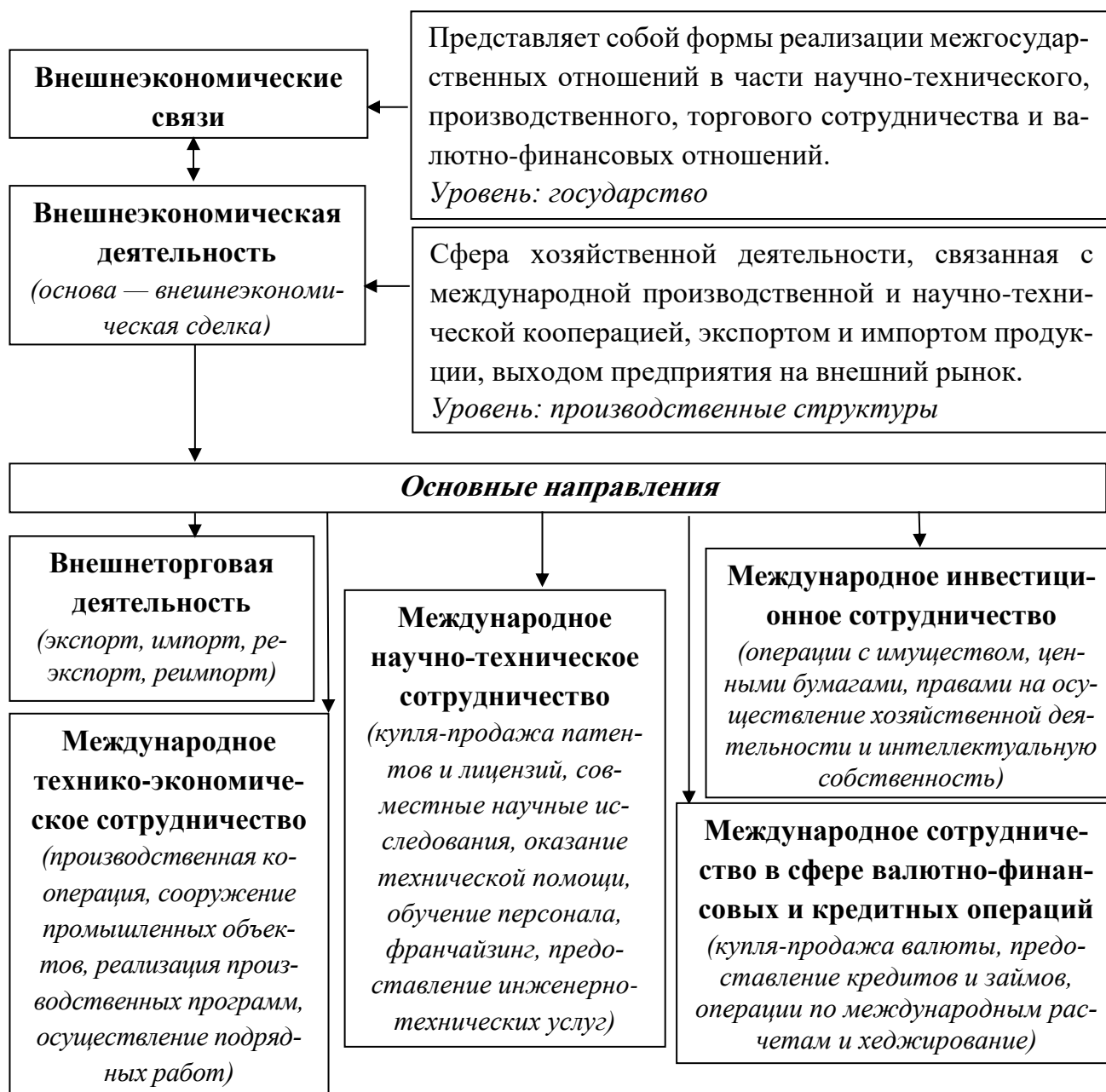
Рис. 1.3. Структура внешнеэкономической деятельности

теории: если все страны будут экспортировать товары, то кто будет их импортировать?