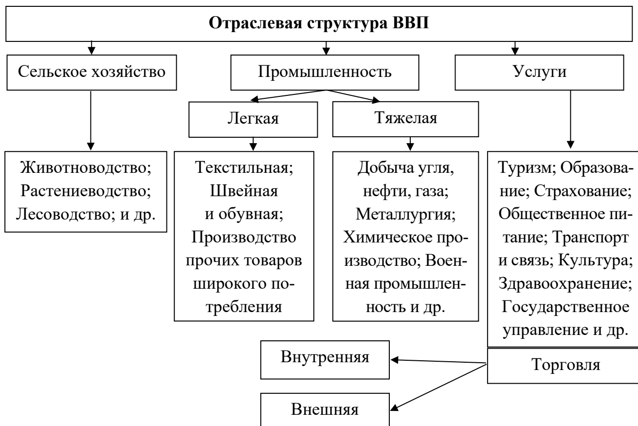
Рис. 1.1. Место торговли в отраслевой структуре ВВП

производство и наличие товаров вполне отделимы во времени и пространстве от соответствующих торговых операций (рис. 1.1).